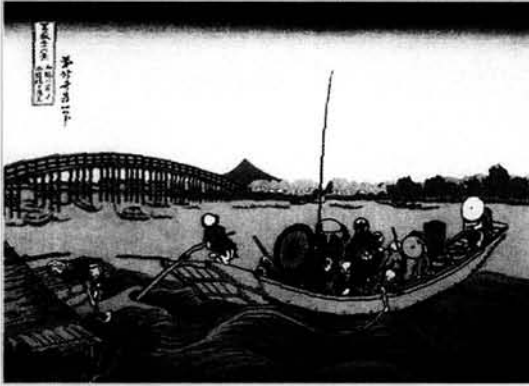
Figura 1. Puesta de sol detrás del puente sobre el río Onmayagashi.