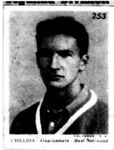
Figura 10. Cromo de fútbol, temporada 1944-1945.

dad, que es la que Chillida ha transmitido a este elemento central del conjunto escultórico de Homenaje a Hokusai .