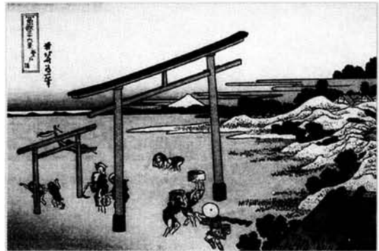
Figura 4. La ría de Nobuto.