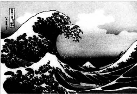
Figura 3. La gran ola en la costa de Kanagawa.