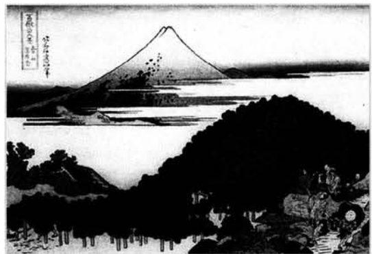
Figura 6. El pinar redondo de Aoyama.