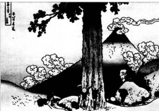
Figura 5. El desfiladero de Mishima en la provincia de Kai.