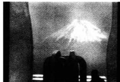
Figura 8. Fotomontaje del proyecto de Homenaje a Hokusai.

llegar al gran formato en una siderurgia del País Vasco (Aceros y Forjados Reinos). La elaboración ha durado dos meses, durante los cuales la gran pieza de 15 toneladas ha sufrido inevitables modificaciones, provocadas por la propia expresión del material. Estos cambios no disminuyen el valor del trabajo, ya que el propio Chillida considera que sus obras son preguntas, de las cuales únicamente contesta el cincuenta por ciento. Una vez finalizada la fabricación, el conjunto escultórico será trasladado a Zabalaga , lugar donde el escultor vasco quiere establecer su fundación; Allí, al aire libre, seguirá el proceso de oxidación, antes de ir al Japón. Al artista no le preocupa el tiempo que pueda transcurrir hasta la ubicación definitiva, porque el presente no tiene medida, pues está entre el pasado y el futuro . Por la forma y la disposición de las cinco piezas angulares, la escultura se propone crear un espacio interior y acogedor con la visión del Fuji, destinado tanto a la contemplación interior como a la observación exterior.