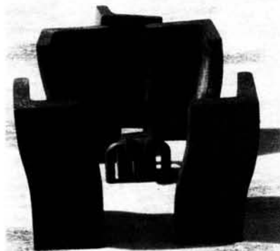
Figura 7. Proyecto de Homenaje a Hokusai.

notable, pasó a llamarse litsu . Con este nombre pinta su producción más famosa: las treinta y seis vistas del Monte Fuji-Yama . Es un conjunto de extraordinarias pinturas, que permiten contemplar la montaña más popular del Japón. La representa situada en un segundo término, a veces lejano, mientras que en un primer plano se desarrollan las más variadas escenas. La más famosa de estas obras es la conocida como La gran ola en la costa de Kanagawa . Con el nombre de Manji vive la última etapa, en la cual publica un libro de grabados: Cien vistas desde el Fuji ,