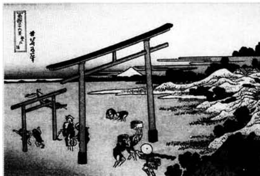
Figura 4. La ría de Nobuto.