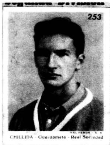
Figura 10. Cromo de fútbol, temporada 1944-1945.

dad, que es la que Chillida ha transmitido a este elemento central del conjunto escultórico de Homenaje a Hokusai .