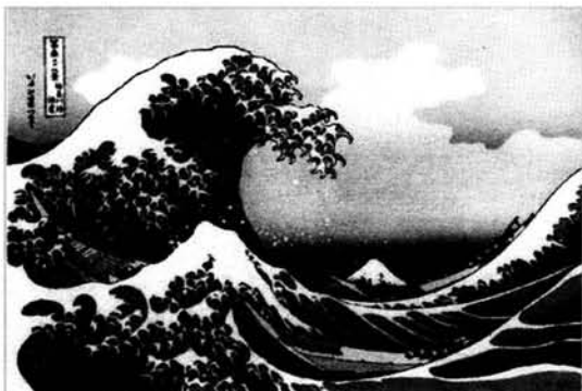
Figura 3. La gran ola en la costa de Kanagawa.