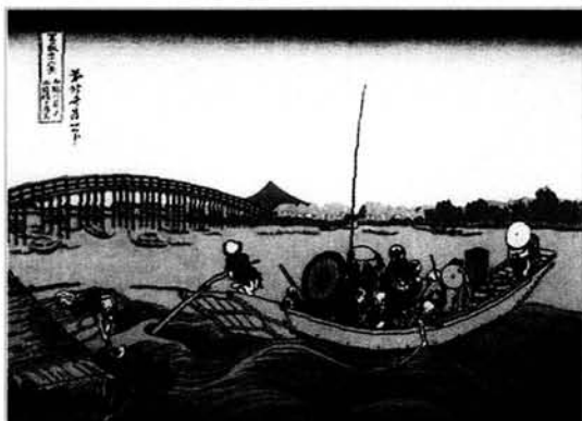
Figura 1. Puesta de sol detrás del puente sobre el río Onmayagashi.