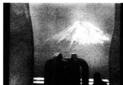
Figura 8. Fotomontaje del proyecto de Homenaje a Hokusai.

llegar al gran formato en una siderurgia del País Vasco (Aceros y Forjados Reinos). La elaboración ha durado dos meses, durante los cuales la gran pieza de 15 toneladas ha sufrido inevitables modificaciones, provocadas por la propia expresión del material. Estos cambios no disminuyen el valor del trabajo, ya que el propio Chillida considera que sus obras son preguntas, de las cuales únicamente contesta el cincuenta por ciento. Una vez finalizada la fabricación, el conjunto escultórico será trasladado a Zabalaga , lugar donde el escultor vasco quiere establecer su fundación; Allí, al aire libre, seguirá el proceso de oxidación, antes de ir al Japón. Al artista no le preocupa el tiempo que pueda transcurrir hasta la ubicación definitiva, porque el presente no tiene medida, pues está entre el pasado y el futuro . Por la forma y la disposición de las cinco piezas angulares, la escultura se propone crear un espacio interior y acogedor con la visión del Fuji , destinado tanto a la contemplación interior como a la observación exterior.