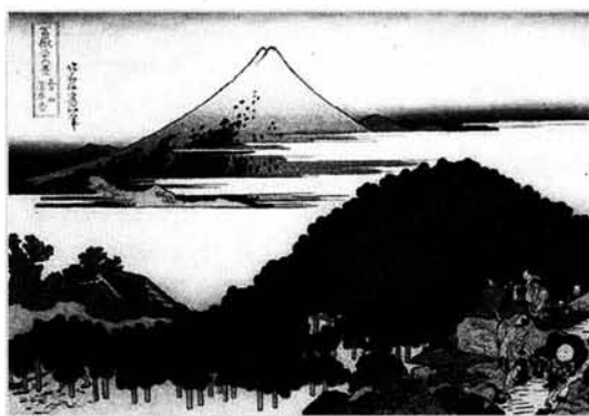
Figura 6. El pinar redondo de Aoyama.