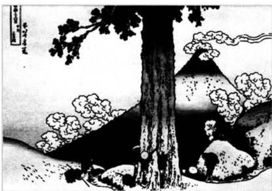
Figura 5. El desfiladero de Mishima en la provincia de Kai.