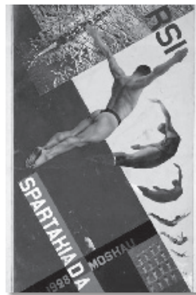
Spartakiada de Moscú (1928)

La “Socialist Workers’ Sport Internacional” (Internacional Socialista de Deporte de los Trabajadores) había organizado en 1925 una olimpiada de los trabajadores que se celebró en Frankfurt (Alemania) y a la que se impidió la asistencia de deportistas soviéticos. Por ese motivo, para conmemorar el 10º Aniversario del movimiento deportivo soviético creado con el Vsevoluch, se decidió organizar una gran manifestación deportiva en la línea de espectáculos de masas, organizándose en Moscú del 12 al 27 de agosto de 1928 (15 días),