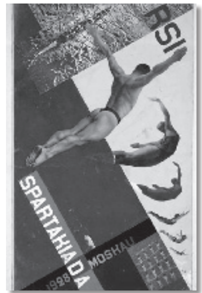
Spartakiada de Moscou (1928)

La “Socialist Worker's Sport Internacional” (Internacional Socialista d'Esport dels Treballadors) havia organitzat el 1925 una olimpíada dels treballadors, que es va celebrar a Frankfurt (Alemanya) i a la qual es va impedir l'assistència d'esportistes soviètics. Per aquest motiu, per commemorar el 10è Aniversari del moviment esportiu soviètic creat amb el Vsevobuch, es va decidir organitzar una gran manifestació esportiva en la línia d'espectacles de masses, i es van organitzar a Moscou, del 12 al 27 d'agost de 1928 (15 dies),