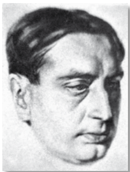
López-Picó per Ferran Callicó.