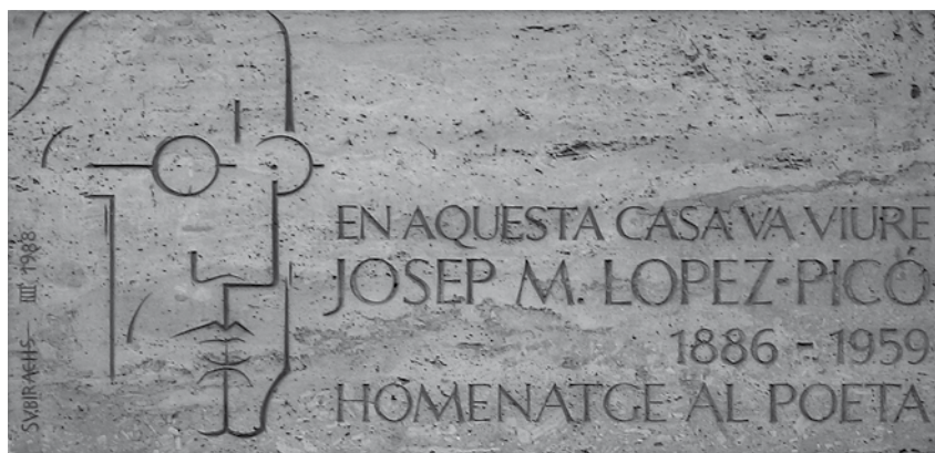
Inscripció a la casa on va habitar el poeta (Rambla de Catalunya, 121), obra de J.M.Subirachs

conjuntament amb Joaquim Folguera, La Revista i Les publicacions de la Revista . Ambdues eren publicacions de caire eminentment noucentista, encara que des del primer moment proporcionaven àmplies referències d'obres i autors de les, aleshores, noves avantguardes. Aquestes referències es van manifestar en algunes seccions concretes, com ara les titulades "poetes estrangers d'avui", "poetes catalans", "les arts plàsti-