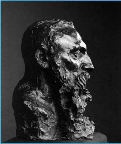
Auguste Rodin. Bronce, por Camile Claudel.