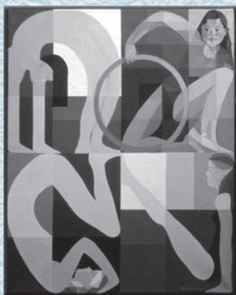
Gimnasia artística (Óleo sobre tela)