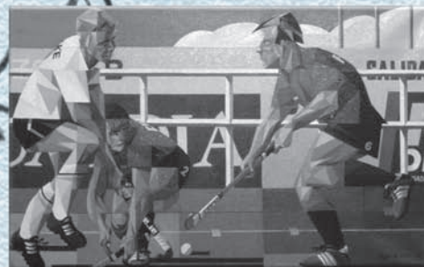
Hockey (Óleo sobre tela)