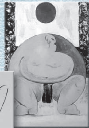
Sumo (Tècnica mixta)