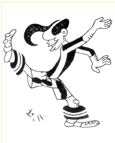
Samitier, por Antoni Roca

Samitier había nacido en el barrio de Les Corts de Barcelona, el día 2 de febrero de 1902. Se dice que desde pequeño hacía maravillas con pelotas de trapo. Después de un periodo en el Internacional, entró en el Barcelona a los 17 años. Debutó en el primer equipo el 31 de mayo de 1919. Samitier (SAMI) era un goleador nato, de extraordinaria técnica ( El mago del balón ), de gran rapidez y con una fantástica capacidad de salto ( El hombre langosta ). Su lugar preferido en el equipo era el de delantero centro, aunque durante unas temporadas jugó de medio ala (según la antigua nomenclatura futbolística). En los trece años que estuvo en el Barça, jugó 458 partidos y marcó 319 goles; durante este tiempo se ganaron 10 Campeonatos de Cataluña, 5 Copas de España y la primera Liga española. También en estos años, el campo de la calle de la Industria quedó pequeño y ello obligó al Club a construir el campo de Las Corts.