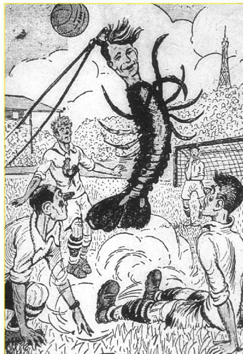
"L'home llagosta", por Salvador Mestres