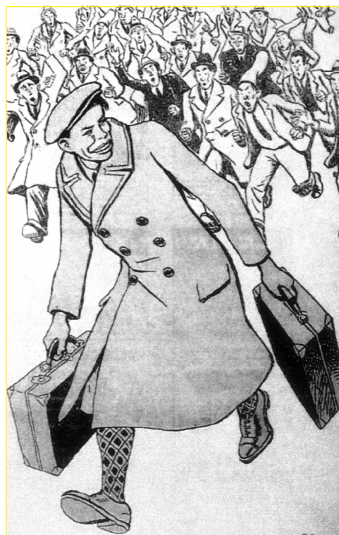
Huyendo hacia Madrid, por Opisso