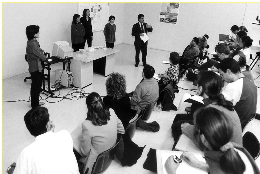
El ambiente de discusión e intercambio en el taller 2.

tar. En otros, en cambio, costó mucho encontrar iniciativas de manera que la labor de coordinación llegó a tener, a veces, un aire detectivesco.