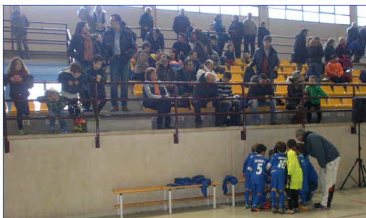
Figure 2. “War cry” of the team before beginning the game before relatives and close friends

La identidad del equipo fomenta el desarrollo de una competencia para la defensa a ultranza de la solidaridad interna y los intereses de sus miembros, donde los protagonistas y foco de atención son los jugadores. (Figura 2)