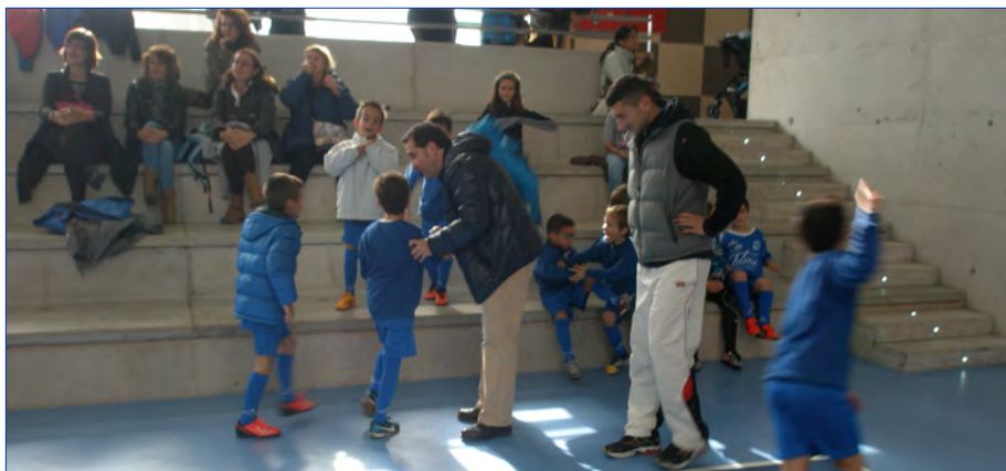
► Figure 4. Families get their children ready to start warming up for a game

Els pares esperen als seus fills a la sortida del col·legi, els donen el berenar, la roba del futbol, els ajuden a canviar-se per realitzar l'entrenament i els esperen per recollir-los hora i tres quarts després dos dies a la setmana (28/10/2014). (Figura 4)