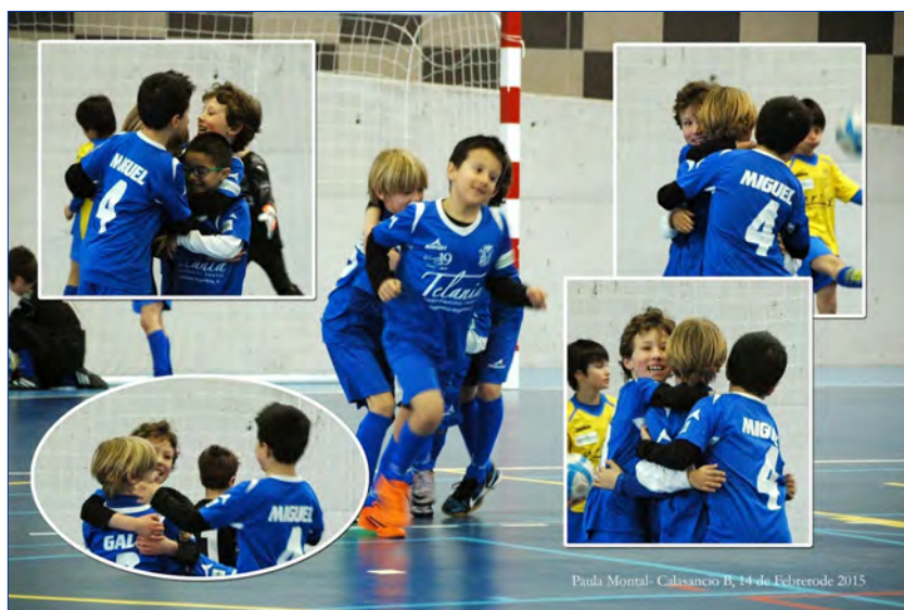
► Figure 3. Goal celebrations by the starting line-up.

La cooperació facilita la complicitat, un vincle afectuós que posseeixen els membres amb més afinitat. S’intervé perquè es creï un clima d’amistat entre els jugadors: àpats, aniversaris, regals per a tots... (Figura 3).