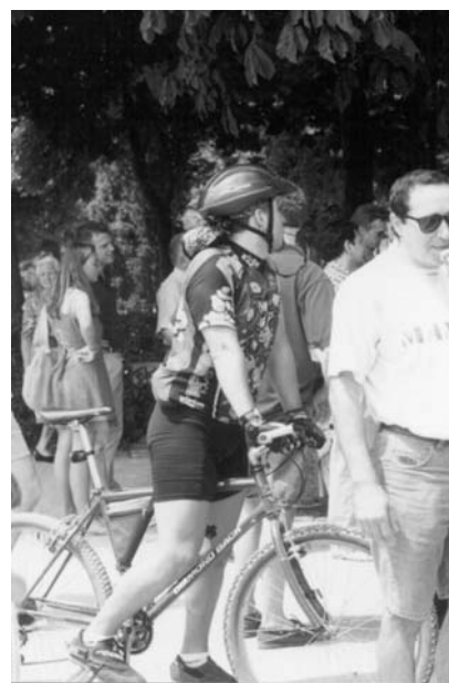
Un ciclista amb equip d'aventurer s'endinsa en el passeig principal de vianants del parc del Retiro de Madrid un matí de sol de diumenge.

L'èxit multinacional de la venda de bicicletes no va ser degut al sobtat afany de milions d'esportistes per llançar-se a màxima velocitat pels pendents muntanyosos, sinó prioritàriament a l'ús alternatiu en el context urbà i la utilització per a activitats en el medi natural, sota el context que hem anomenat tropicalisme festiu . En aquest sentit, la bicicleta de muntanya incorpora nombrosos avantatges sobre la bicicleta tradicional de passeig: la robustesa de les rodes disminueix enormement el risc de punxades i reben-tades als sots i vorades; la gamma de desenvolupaments dels canvis (conjunt plat-cadena-pinyó) permet d'afrontar pu-