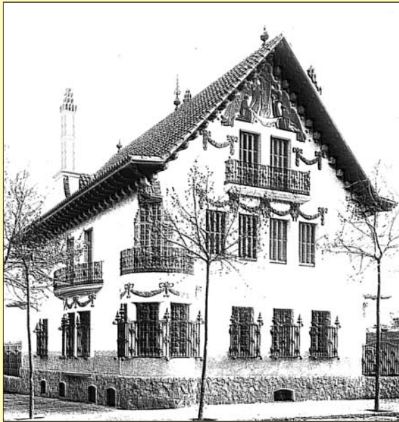
La Casa Company. Aspecte primitiu (1911)