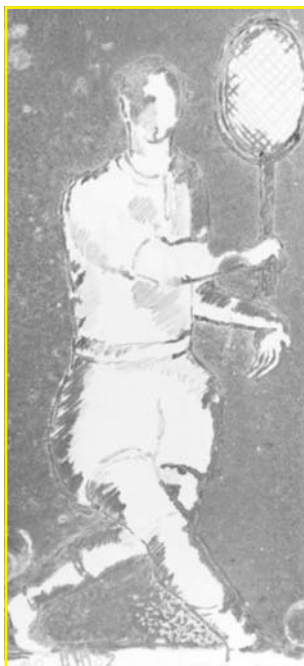
Tennista Ceràmica, 980 °C, òxid manganès sobrecoberta