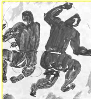
Pescadors Ceràmica, 980 °C, òxid manganès sobrecoberta