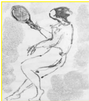
Tennista Gres, esmalt base zinc, 1.260 °C