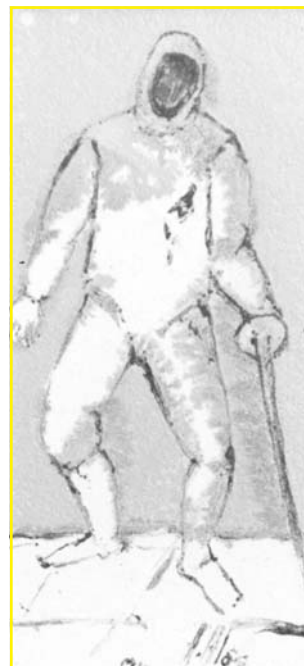
Esgrimidor Ceràmica, 980 °C, òxid manganès sobrecoberta

La seva obra és diversa i complexa, tant en materials com en tècniques i varietat de formes; va des de peces seriades a la peça única, passant pels murals de grans dimensions. La seva extensa producció, segons Sempere, pot englobar-se bàsicament en quatre grans apartats: el primer, format pels gerros deformes ; el segon, el componen les natures mortes , amb representacions de figures d'animals o simbòliques; el tercer, són les plaques i els grans murals , de textures rugoses, alguns dels quals són senzillament genials; i finalment, les seves peces predi-lectes, els plats , sols, engalzats o muntats en un pedestal, tipus fruitera. L'Angelina trenca amb els conceptes clàssics i modela fora del torn objectes escultòrics. Les seves peces adquireixen lluminositat i colorit, molts cops metal·litzat, que ens porta al blau de les fondàries del mar, al blau del cel, al verd dels prats, al blanc infinit de les neus, als reflexos de les aigües cristal·lines del fons dels brolladors o a la infinitat dels grocs, ocres terrosos o malves de la tardor. En les seves obres, estripa els materials, els fon, els deforma i els barreja: gres amb porcellana, amb teles i amb cúmuls de vernís. De vegades crea formes grotesques i abstractes provocant l'espectador en proposar-li un nou llenguatge i una nova lectura d'un estrany simbolisme. És important esmentar els aspectes més tècnics del seu tre-