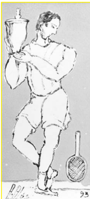
Guanyador Ceràmica, 980 °C, òxid manganès sobrecoberta