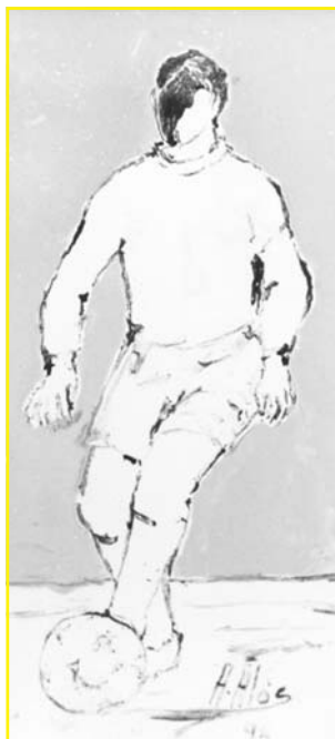
Futbolista Ceràmica, 980 °C, òxid manganès sobrecoberta