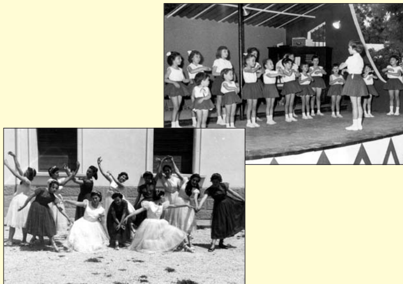
Cuentos Gimnásticos: Festival Bazar (1960), y exhibición de final de curso (1956) del Círculo de Juventudes de la SF de Jaén.

La década de los sesenta comienza con el reconocimiento oficial del Título de Profesora de EF por el MEN, el 10 de noviembre de 1960, convalidando los otorgados por la Escuela Nacional de Especialidades “Julio Ruiz de Alda” y aprobando sus Planes de Estudios. Pero con la promulgación de la Ley de EF y Deportes (23 de diciembre de 1961), sólo un organismo perteneciente a la Secretaría General del Movimiento, la Delegación Nacional de EF y Deportes, se encargará de controlar todas las actividades, el Instituto Nacional de Educación Física (INEF), creado en virtud de esta Ley, “como Centro Oficial reconocido por el MEN, expedirá los títulos del Profesorado de EF”, aunque la misma Ley, con respecto a las profesoras, dice: “la formación del profesorado femenino del Instituto Nacional se realizará en la Escuela Nacional Julio Ruiz de Alda, centro oficial reconocido por el