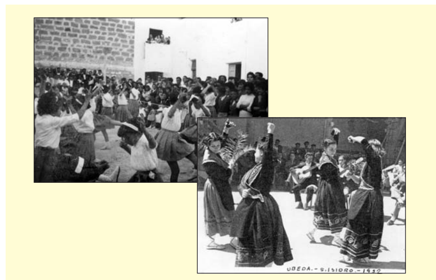
Iniciació a les dances a la Càtedra Ambulante de la Solera, i Dances i Balls regionals de la SF a la Festa de San Isidro Labrador (Úbeda, 1952). A Veinte años de paz en el movimiento nacional bajo el mando de Franco: Provincia de Jaén (1959).

El 1946, la Regidoria Central d'EF elabora un document recordant a totes les esportistes i Instructores la doctrina essencial de la SF, i on s'afirma que " un dels punts on és més necessària l'acció social formativa de la Falange, és el camp de l'EFF ". L. Segons Suárez (1993, pàg. 178): " la meta immediata que s'havia proposat, era la regeneració física de la dona ". Amb aquesta finalitat se seleccionen els esports ideals des d'una perspectiva tècnica i moral: gimnàstica, dansa (tot unint la clàssica a les folkloriques), ritme i cinc esports: esquí, natació, hoquei, handbol i bàsquet. L'atletisme s'exclouria dels esports de la SF fins al 1961, per considerar-lo "masculinitzant