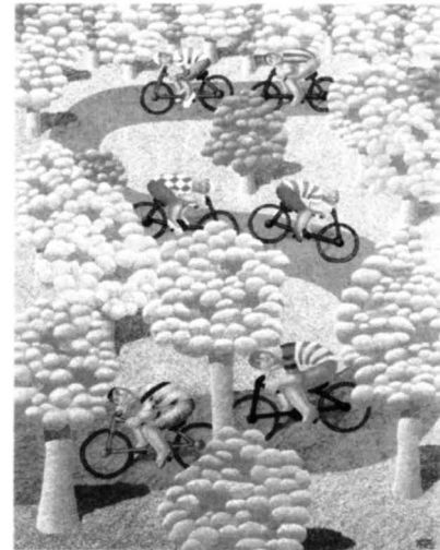
Figura 4. Ciclistas (E. Pavaneli).