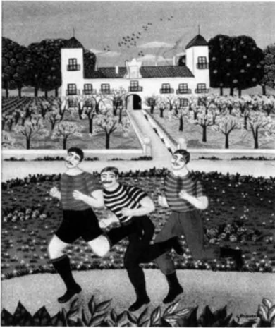
Figura 3. Corredores (G. Risveiro).

El arte naïf, como apunta el subtítulo del Museo, es marginal y popular . No es un estilo, ni está marcado por una norma artística. Recoge la actividad creadora de artistas de todas las condiciones sociales, muchas veces de vocación tardía, autodidactas y sin relación con la cultura "oficial" o academicista. No tiene escuela, ni maestro y es esencialmente sincero y espontáneo. El artista naïf, que produce por necesidad de comunicación, capta el mundo real con espontaneidad y sencillez, de tal ma-