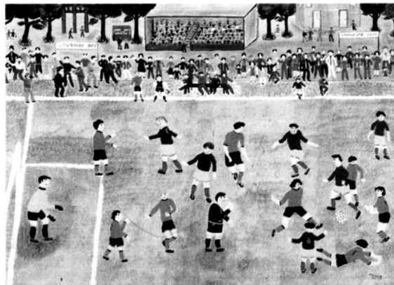
Figura 1. Futbol (R. Boissier).

El Museu està emplaçat en un antic molí construït a mitjans del segle XIX per encàrrec del Marquès de la Torre , fet que ocasionà que la propietat rebés el nom de Molí de la Torre. L'any 1911 la casa va estar adquirida per la cantant Maria Gay, membre de la família Pitxot de Figueres. És coneguda l'amistat entre els Pitxot i els Dalí, la qual cosa va facilitar que l'any 1916, el jove Salvador Dalí que aleshores tenia dotze anys, passés una curta temporada al Molí de la Torre. Allí, segons explica Dalí en el seu llibre Vida Secreta , va descobrir l'impressionisme a través de l'obra de Ramon Pitxot i va intentar convertir-se ell mateix en pintor impressionista. Actualment el Molí de la