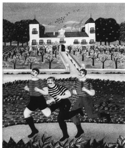
Figura 3. Corredors (G. Risveiro).

L'art naíf, com apunta el subtítol del Museu, és marginal i popular . No és un estil, ni està marcat per cap norma artística. Recull l'activitat creadora d'artistes de totes les condicions socials, moltes vegades de vocació tardana, autodidactes i sense relació amb la cultura "oficial" o academicista. No té escola, ni mestre i és essencialment sincer i espontani. L'artista naíf, que produeix per necessitat de comunicació, capta el món real amb esponta-