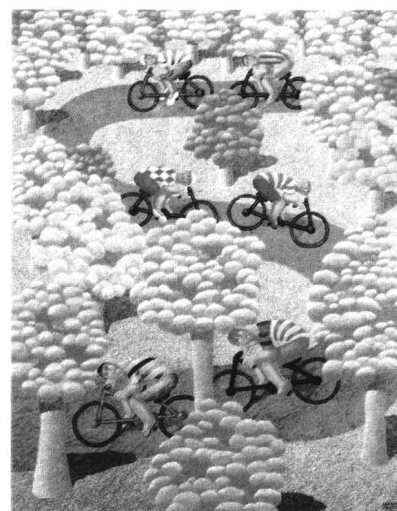
Figura 4. Ciclistes (E. Pavanelli).