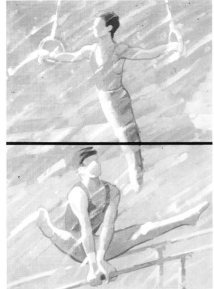
Fig. 3. Gimnasia (Colección FCG).

de surrealismo, especialmente visibles en sus nubes. La personalísima textura de los cuadros, formada por múlti-