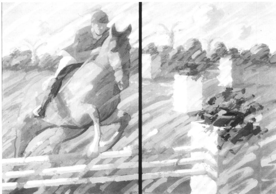
Fig. 1. Hípica.

A principios de este año, Josep Fossas (Capdevànol, 1940) presentó en el Museu de l'Esport de Barcelona la se-