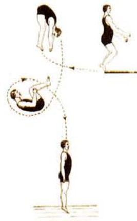
Fig. 52.—Carpa hacia atrás, con salto mortal