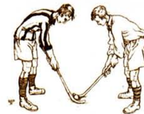
Fig. 1.—Golpe de salida (bully)