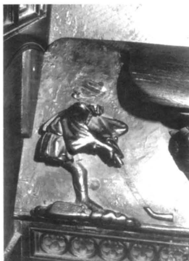
Figura 4. Personaje lado izquierdo: A) 1909. B) 1997.

Gracias al primero de los acontecimientos, se ha realizado una importante tarea de limpieza, restauración e iluminación de la sede barcelonesa. Concretamente, en el coro se ha instalado una iluminación con fibra óptica que permite contemplar perfectamente las diferentes partes de la sillería. La misericordia del hockey ha sido restaurada, creemos que con acierto. Quizá los fragmentos nuevos no han recibido un acabado suficientemente adecuado que disimulase totalmente los añadidos, pero el resultado es correcto. Los jugadores han recuperado las cabezas, la pierna y los sticks dañados. Nos preguntamos ¿cómo eran primitivamente las partes restauradas de estas figuras? La referencia más antigua que hemos podido encontrar es un artículo publicado en la revista L'Aven del mes de noviem-