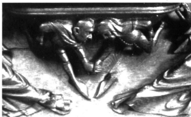
Figura 7. Misericordia MNAC. Fragmento