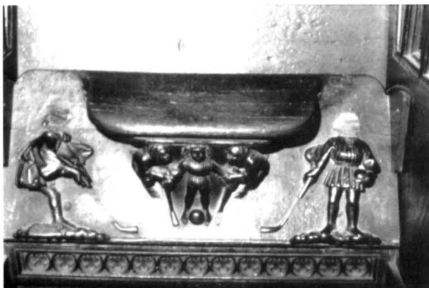
Figura 2. Miseriçordia hockey (1984)