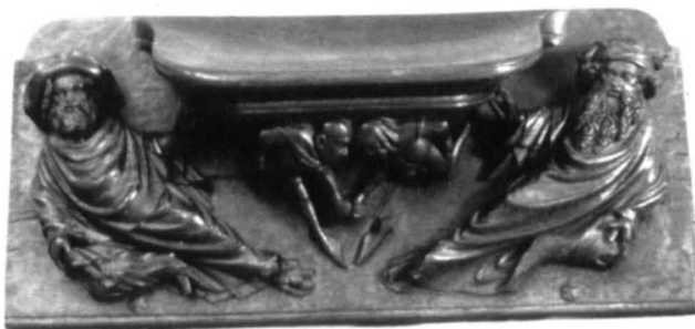
Figura 6. Misericordia MNAC