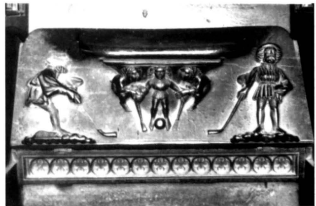
Figura 1. Miseriçordia hockey

En aquel trabajo, hablábamos de cuatro miseriçordias con escenas de Juegos y Deportes. En una de ellas, unos niños desnudos están jugando a tirar de una cuerda; en otra, se representa una escena de caza mayor, posiblemente del jabalí; en una tercera, dos hombres están jugando a pelota con unas paletas, mientras que otros dos parece que están in-