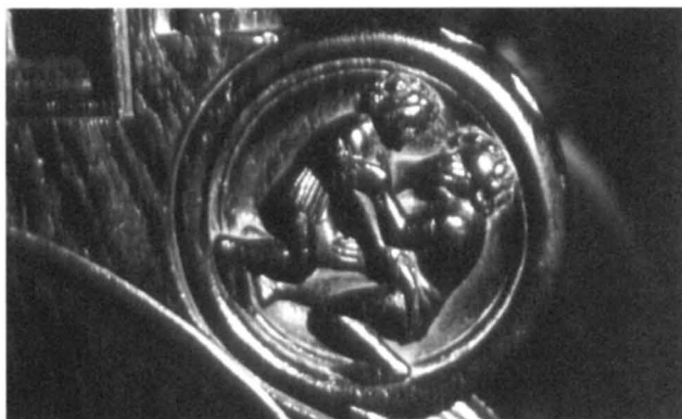
Figura 8. Medallón escena de lucha