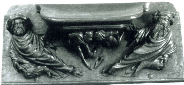
Figura 6. Misericordia MNAC