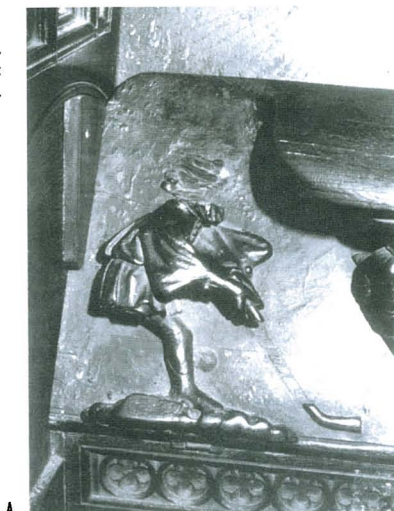
Figura 4. Personaje lado izquierdo: A) 1909. B) 1997.

Gracias al primero de los acontecimientos, se ha realizado una importante tarea de limpieza, restauración e iluminación de la sede barcelonesa. Concretamente, en el coro se ha instalado una iluminación con fibra óptica que permite contemplar perfectamente las diferentes partes de la sillería. La misericordia del hockey ha sido restaurada, creemos que con acierto. Quizá los fragmentos nuevos no han recibido un acabado suficientemente adecuado que disimulase totalmente los añadidos, pero el resultado es correcto. Los jugadores han recuperado las cabezas, la pierna y los sticks dañados. Nos preguntamos ¿cómo eran primitivamente las partes restauradas de estas figuras? La referencia más antigua que hemos podido encontrar es un artículo publicado en la revista L'Avens del mes de noviem-