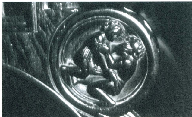
Figura 8. Medallón escena de lucha