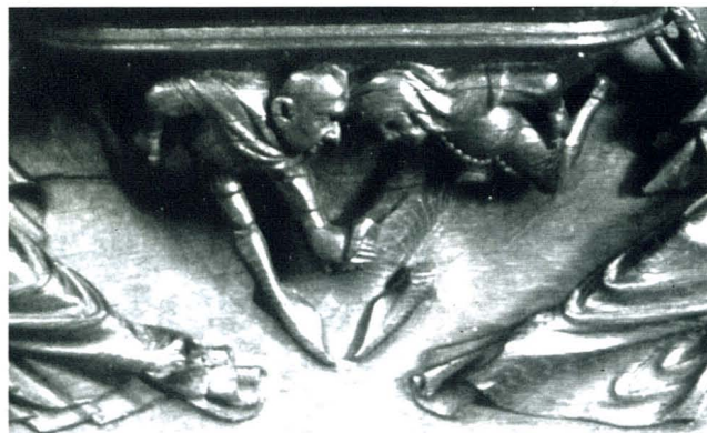
Figura 7. Misericordia MNAC. Fragmento