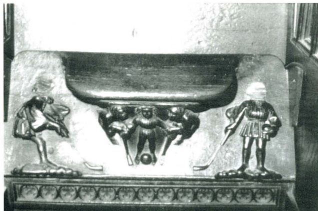
Figura 2. Misericordia hockey (1984)