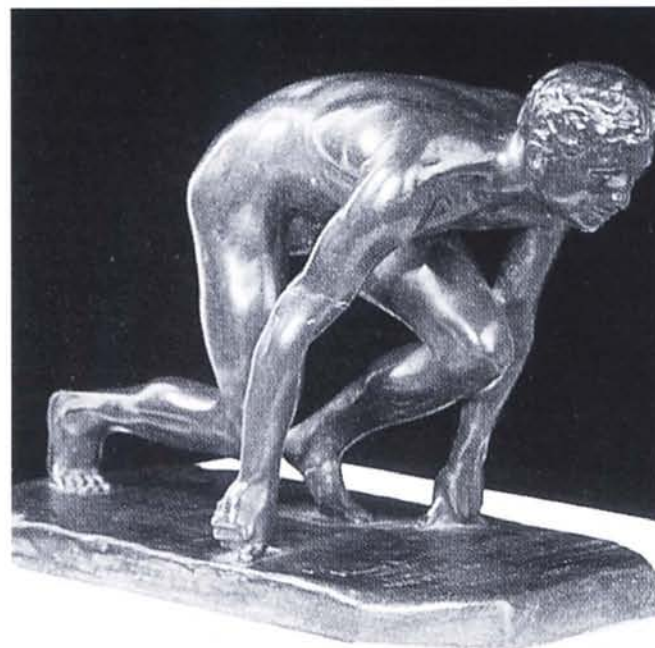
Figura 1. Sprinter , 1902. Bronce, altura 23 cm.