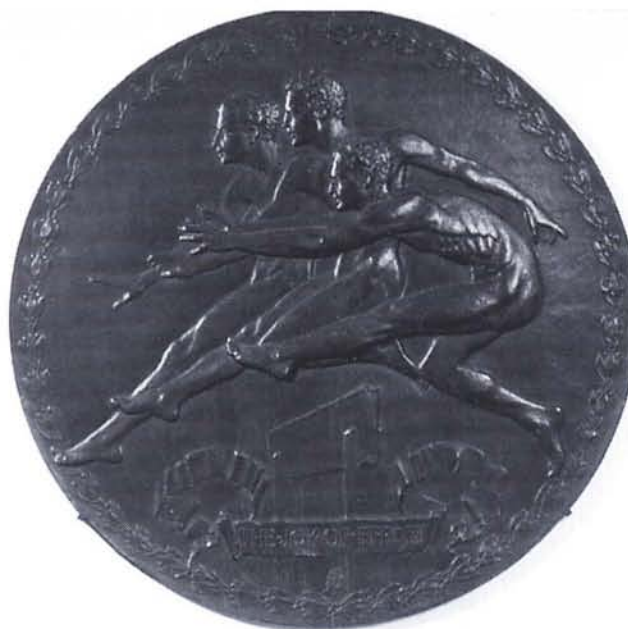
Figura 3. Joy of Effort , 1912. Bronce, diámetro 117 cm