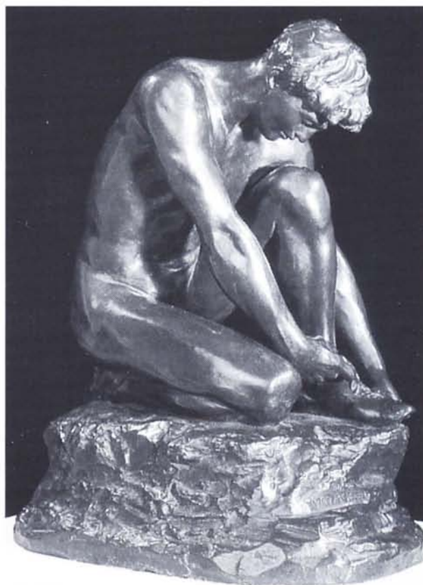
Figura 2. Competitor , 1906. Bronce, altura 53 cm.

En el catálogo completo, se contabilizan más de 70 esculturas y relieves, dedicados a diferentes deportes (atletismo —en particular lanzadores de peso y jabalina—, boxeo, natación, fútbol americano, lucha, gimnasia, remo y patinaje) y un número similar de medallas destinadas, además de a los deportes citados, al tenis, al golf, al béisbol y la esgrima. Entre las esculturas y relieves hemos de destacar como más representativos: Sprinter (Velocista), 1902; Athleta (Atleta), 1903; Competitor (Competidor), 1906; Relay runner (Relevista), 1910; Joy of effort (Alegría del esfuerzo), 1912; Shield of Athletes (Escudo de los atletas), 1932; Invictus (Invencible), 1934. Para esta obra, sirvió de modelo el boxeador profesional Joe Brown, que años después sería un importante escultor. La