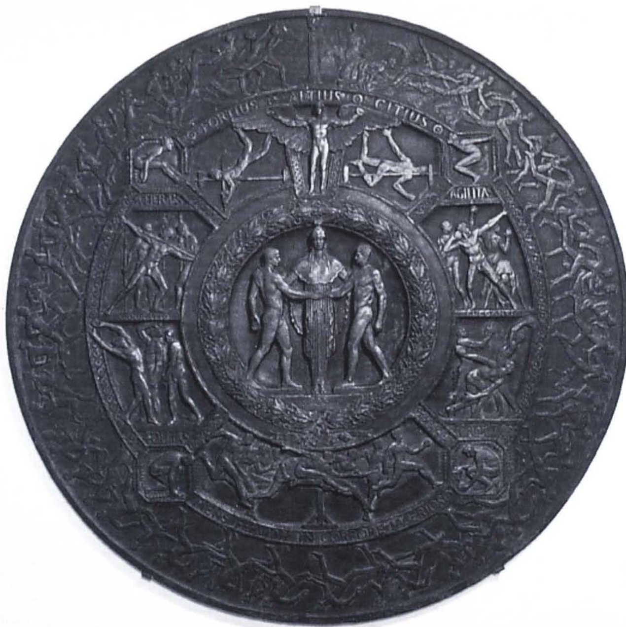
Figura 6. Shield of Athletes , 1932. Medallón de yeso coloreado, diámetro 152 cm.

la "Pax Olímpica", con un apretón de manos entre dos deportistas, ante la diosa Minerva; una corona de hojas de laurel rodea la escena. En otros paneles se representan por medio de figuras clásicas, los distintos concursos atléticos, mientras que periféricamente en una amplia franja, se desarrolla una carrera