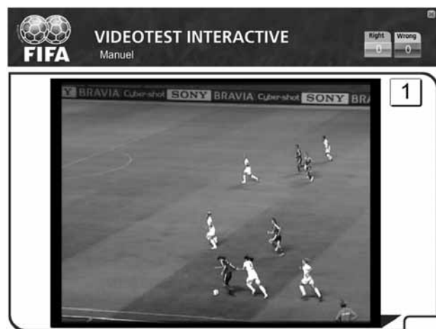
Figura 1 Pantalla del “Vídeo Test Interactivo”