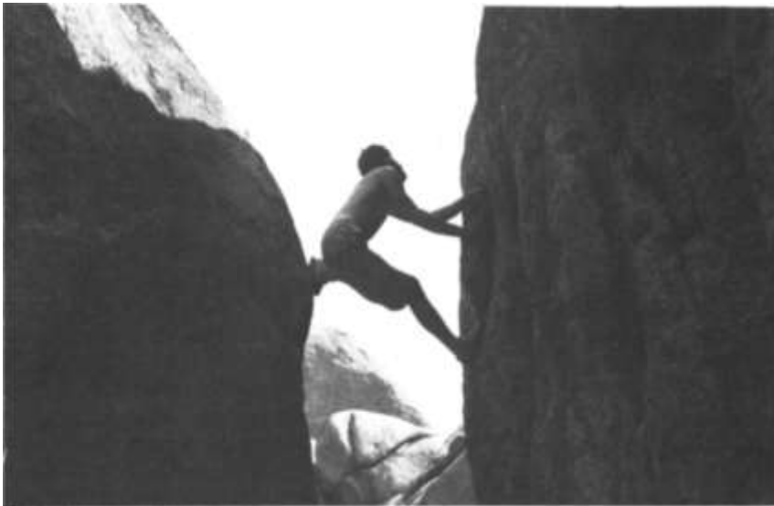
La Pedriza (Madrid). divertiment per les esclertes de dur granit a la zona de «el Yelmo».