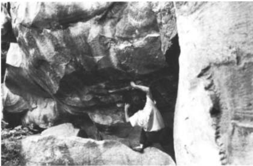
Bosc de Fontaineblau (París). El gres erosionat obliga a difícils temptatives en zones extraplomades.

tota manera, la pràctica estricta serà sempre gratuïta, i solament s'especula amb serveis complementaris.