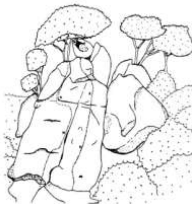
1 Del quatre 2 Escarp guadalupetiquet de