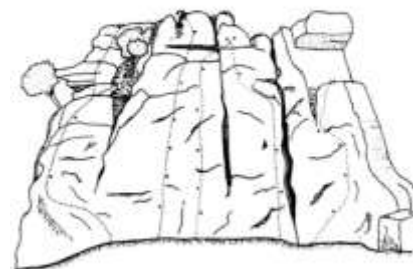
1 Pla de gu de 2 Pla de gu de 3 Pla de gu de 4 Pla de gu de 5 Pla de gu de

quen és un art. Un art que ha descobert la quarta dimensió, la dimensió de ser part de l'estructura de la muntanya, de sentir-la des dins, d'extreure d'uns blocs de roca verge formes i moviments.