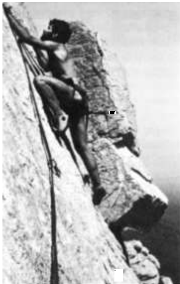
Via «Bicicleta». Ampla placa a la zona de Roques Noves, a l'Escola de Céllecs.

s'escalarà la via per primera vegada anant assegurat amb la corda «per dalt». Mentre s'escala, s'aniran triant els punts concrets on s'instal·laran les assegurances per fer una escalada «de primer», és a dir, amb l'assegurament per baix. Cas de no poder accedir directament a dalt, s'escalarà ja d'entrada la via amb tècniques sovint artificials, mentre s'equipa aquesta directament amb les assegurances.