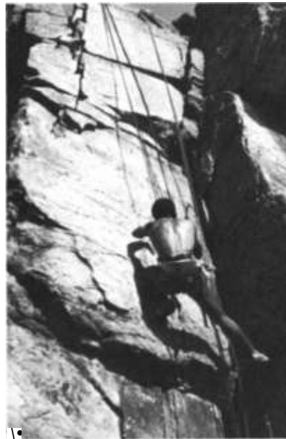
Bosc de Fontaineblau (París). Empotrament de braç en l'ascensió per una esclatxa.

Quant a la distància entre les assegurances, hi haurà una única excepció, i és que entre la primera i la segona hi haurà un recorregut molt curt amb la finalitat de no «picar» a