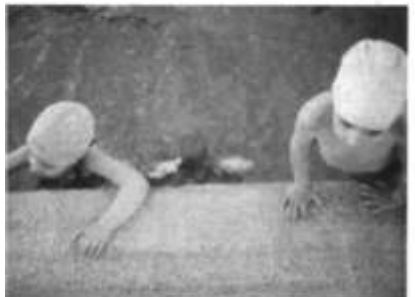
Observant les respostes dels nens a les activitats podem incidir en els aprenentatges aquàtics bàsics