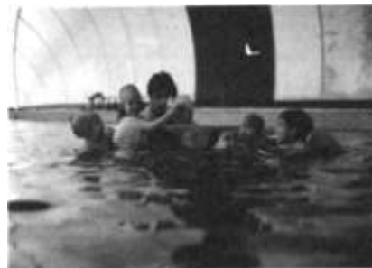
Quan l'adaptació a l'entorn s'assoleix podem realitzar un treball específic envers els aprenentatges aquàtics

Cal reflexionar sobre aquesta activitat i pensar que per fer una aplicació òptima del treball cal valorar: la importància de l'activitat dins el programa escolar, la motivació de l'equip que treballarà l'activitat i els mitjans de què disposarem. Aquesta valoració és important, ja que des del primer moment s'ha d'assumir el treball i aprofundir al màxim en les possibilitats que ens ofereix l'aigua, no només a nivell piscina, sinó des d'un plantejament a fons d'escola incloent-hi l'aigua com a un element més de retorn educatiu del nen.