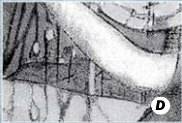
Montaña y Castillo de Montjuïc