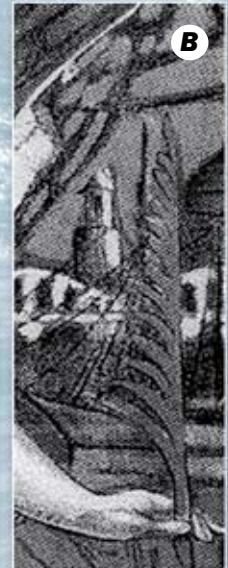
Palma del Martirio